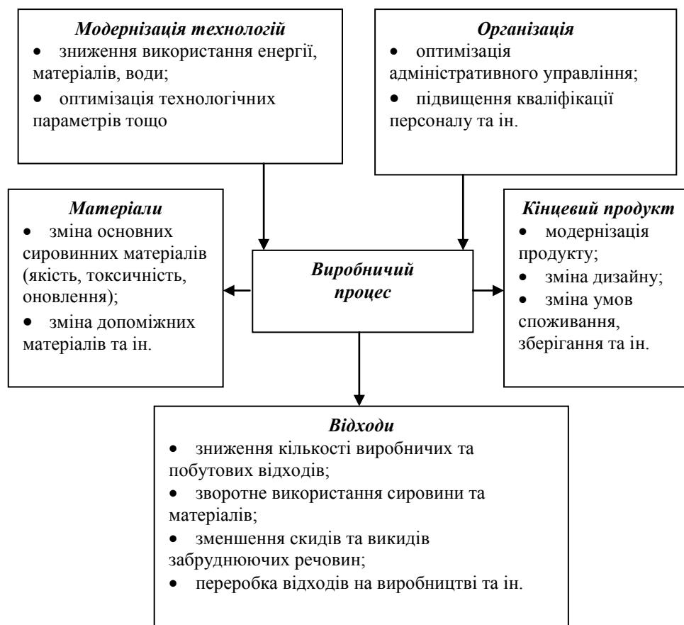
Рис. 2. Структурна схема елементів виробничого процесу під час впровадження екологічно чистого виробництва

Стратегію впровадження екологічно чистого виробництва можна визначити як таку, що має інноваційну складову, змістовна частина якої адекватно відповідає сучасним вимогам спрямованості економіки на сталий розвиток. Інноваційна складову у процесі впровадження екологічно чистого виробництва здатна виявлятися у кожному його елементі. Структурну схему головних елементів екологічно чистого виробництва наведено на рис. 2 [4].