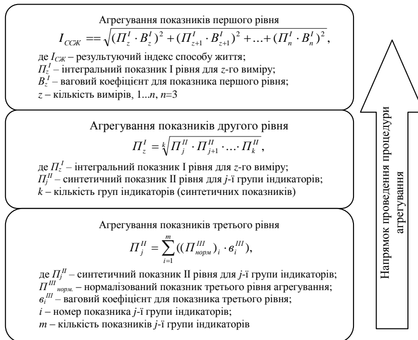
Рис. 1. Етапи агрегування показників сталого способу життя

Процедуру агрегування показників сталого способу життя пропонується проводити за наступними етапами, попередньо нормалізувавши їх значення за стандартною методикою (рис. 1).