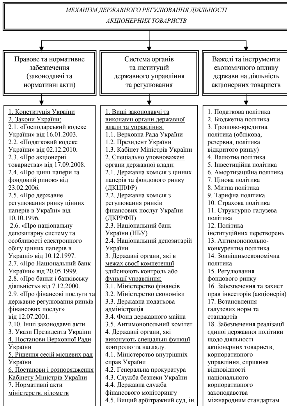
Рис. 1. Складові елементи механізму державного регулювання діяльності акціонерних товариств в Україні