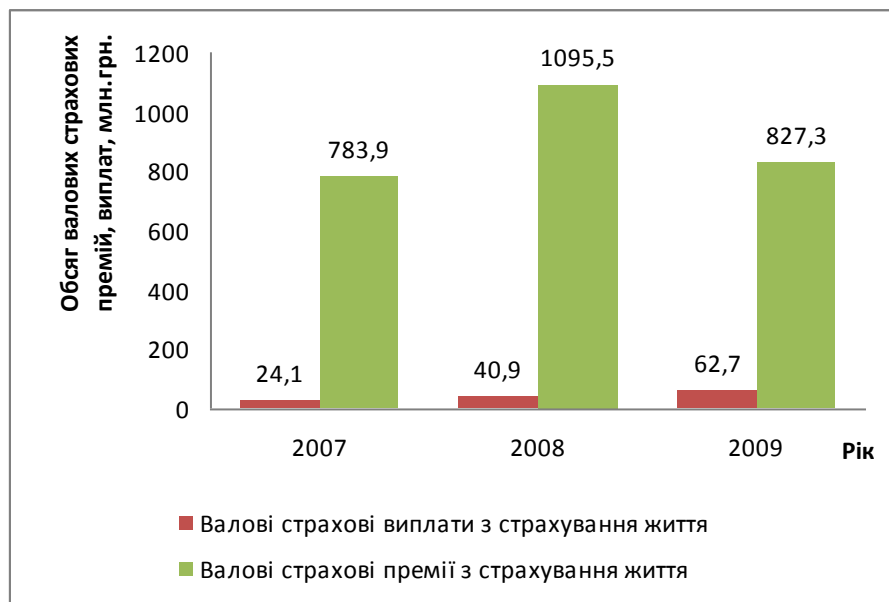
Рис. 3. Динаміка страхових премій та страхових виплат із страхування життя за 2007 – 2009 рр. млн грн