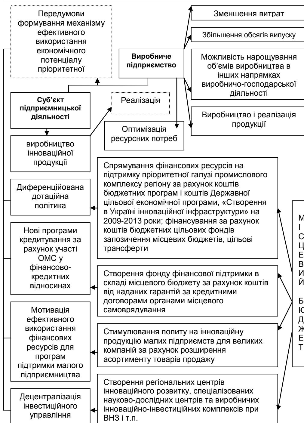
Рис. 2. Схема процесу формування механізму ефективного використання економічного потенціалу виробничих галузей промислового комплексу регіону