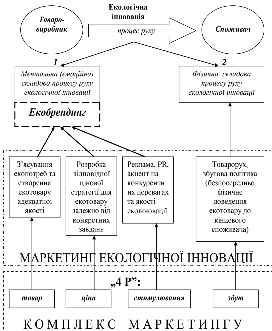
Рис. 3 Роль та місце маркетингу інновацій в екобрендингу

Говорячи про роль та місце маркетингу інновацій в екологічному брендингу, прокоментуємо поданий на рис. 3 взаємозв'язок.