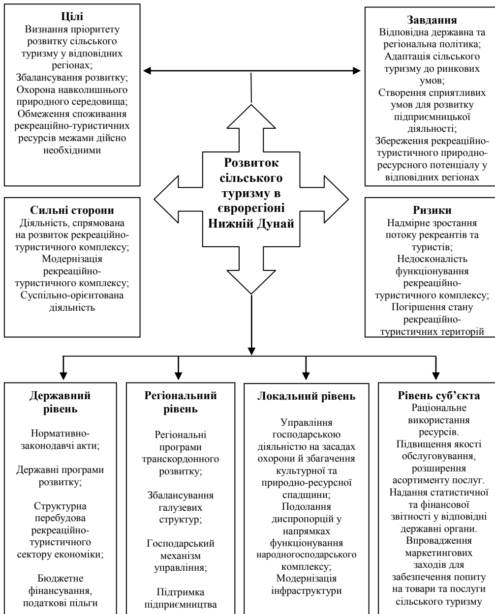
Рис. 2. Цільова модель механізму розвитку сільського туризму в сврорегіоні Нижній Дунай

На нашу думку, запропонована модель механізму дає можливість зосередити цільові установки розвитку сільського туризму на чотирьох рівнях управління: державному,