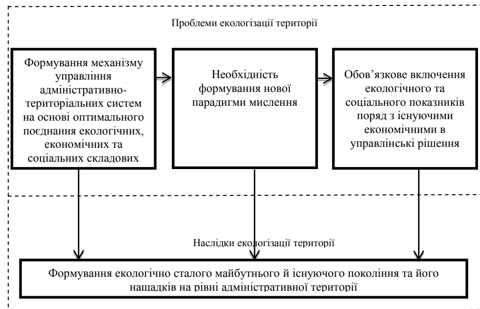
Рис. 1. Проблеми екологізації території

Аналіз наведених проблем дозволяє виявити їх системний характер та взаємозв'язок (рис. 1).