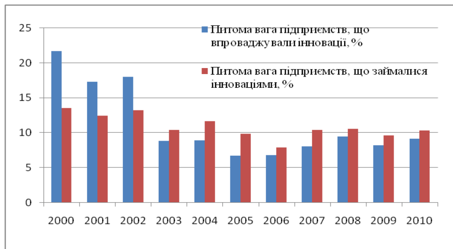
Рис. 1. Динаміка інноваційної активності промислових підприємств

З 2008 року за підтримки Фонду «Ефективне керування» у Донецькій області реалізується пілотний проект «Підвищення економічної конкурентоспроможності регіону». За цим проектом передбачається розвиток двох пріоритетних кластерів: металургійного і сільськогосподарського, які стануть локомотивами зростання; залучення інвестицій; навчання й підготовки кадрів.