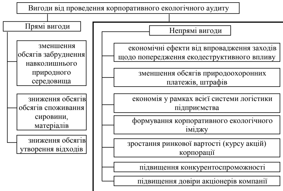
Рис. 1. Вигоди від проведення корпоративного екологічного аудиту

Традиційні науково-методичні підходи щодо визначення ефективності впровадження корпоративного екологічного аудиту дозволяють сформувати в даному випадку дві групи ефектів (вигод) (рис. 1).