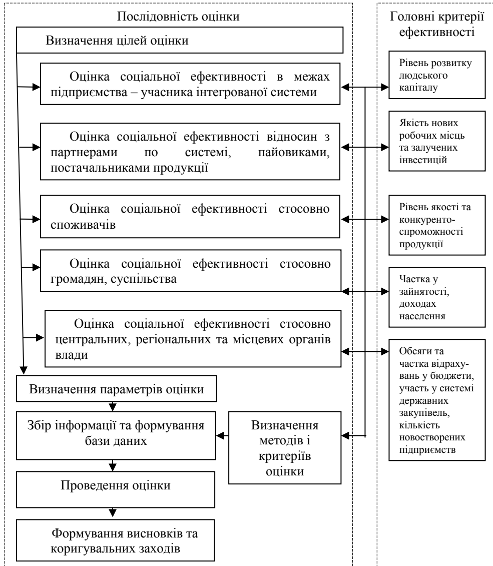
Рис. 3. Послідовність оцінки соціальної ефективності локальних інтегрованих систем

добутків часткових характеристик на коефіцієнти їх вагомості. Формування критеріїв необхідно здійснювати із урахуванням: цілей оцінки, рівня впливу, ознак типологізації функцій у забезпеченні розвитку інтегрованого об'єднання, рівня реалізації фінансово-економічних інтересів його суб'єктів – учасників. У цьому випадку узагальнювальний показник ( I ) може розраховуватися у вигляді лінійної згортки