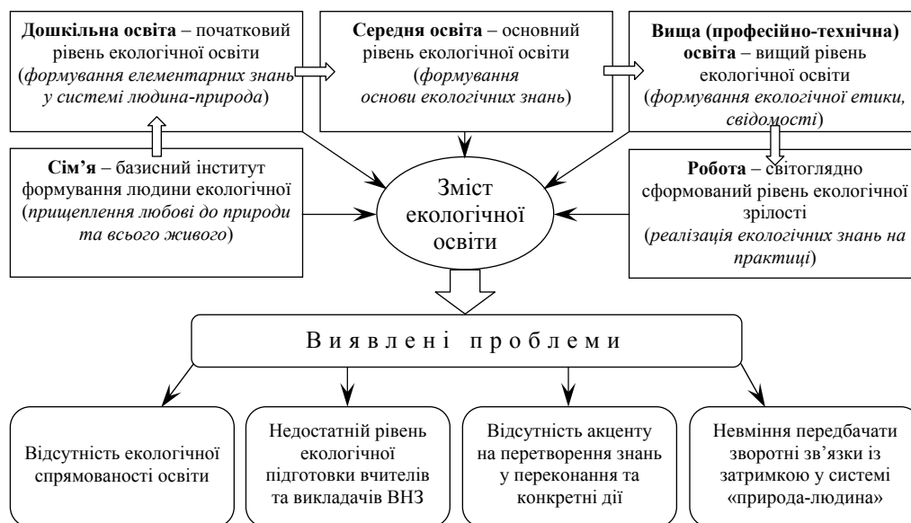
Рис. 4. Етапи формування та проблеми реалізації екологічної освіти в Україні

Проаналізувавши дію цих принципів в Україні, ми дійшли висновку, що на різних етапах екологічна освіта має свої проблеми (рис. 4).