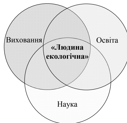
Рис. 3. Середовище формування «людини екологічної»

Для реалізації цих принципів на практиці необхідно створити умови, а точніше середовище формування екологічно свідомих, яке можна представити у вигляді тріади: освіта, наука, виховання (рис. 3).